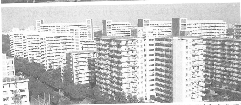
〔一戸建て住宅/集合住宅〕 いっこだ じゅうたく しゅうごうじゅうたく