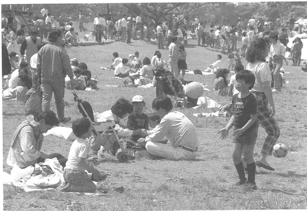
〔家族の休日〕 きゅうじつ