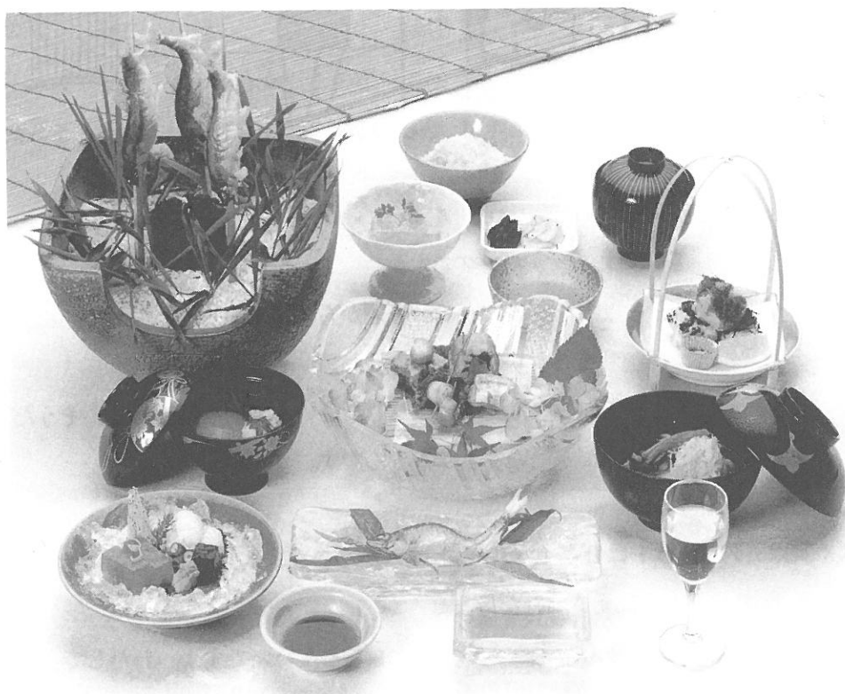
〔日本料理の盛りつけ〕